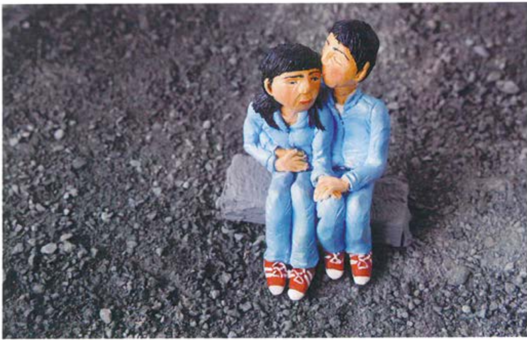
karine giboulo All you can eat. 2008. COLLECTION DU MUSÉE DES BEAUX-ARTS DE MONTRÉAL. Argyle polymère, acrylique, bois, plexiglass et matériaux divers (sculpey, acrylic, wood, plexiglass and mix media). 73"x30"x24" + 67"x34"x24" + 71"x32"x20"x32"