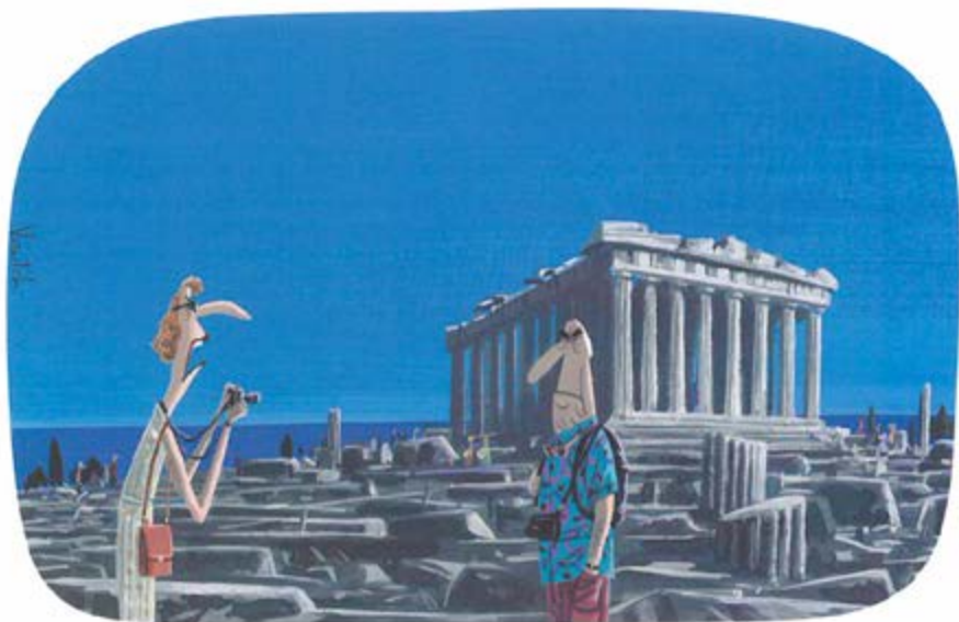
-Est-ce que ce serait vraiment au-dessus de tes forces, Norbert, d'avoir l'air heureux pendant 1/2500ème de seconde?