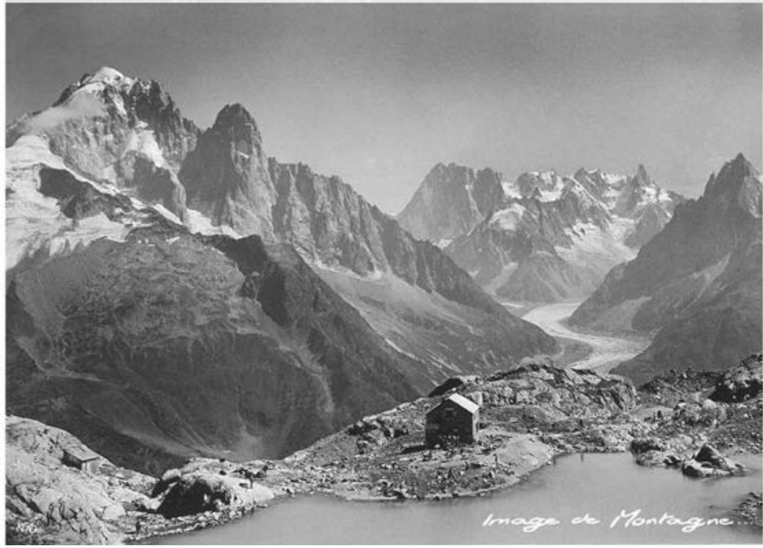
Image de Montagne